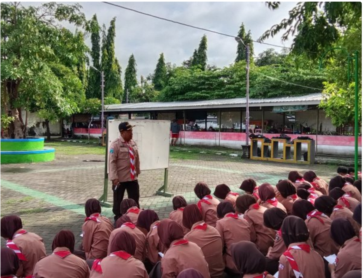
Pramuka Saka Wira Kartika Gelar Kegiatan Mengesan Jejak Untuk Mengasah Keterampilan Anggota

Magetan. Pramuka Saka Wira Kartika Pangkalan Slamet Riyadi Gudup 07.59-07.60 ranting Koramil Tipe B 0804/08 Barat kembali menggelar kegiatan pembinaan dan pelatihan yang bertujuan untuk mengasah keterampilan para